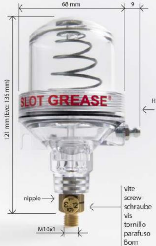
SLOT GREASE® 100 • Classic - Oiler - Evo